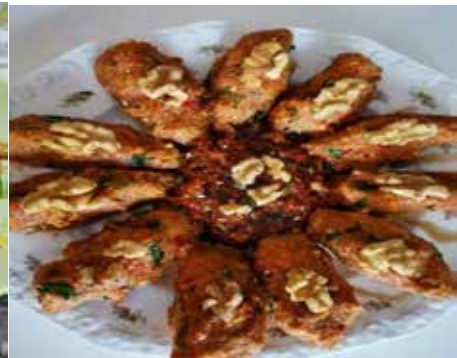
Kobba Nayah Vegetarisch