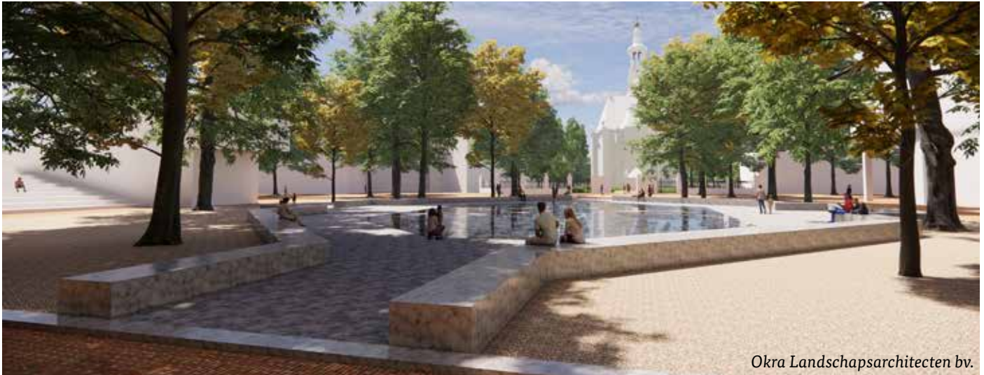
Okra Landschapsarchitecten bv.

De openbare ruimte in het Spuikwartier wordt, nu Cultuurcentrum Amare bijna klaar is, opnieuw ingericht. Binnenkort start de gemeente met het kiezen van de bestrating rondom het stadhuis. Er komt een aantal proefvakken met verschillende steensoorten, kleuren en steenverbanden, om uit te kiezen.