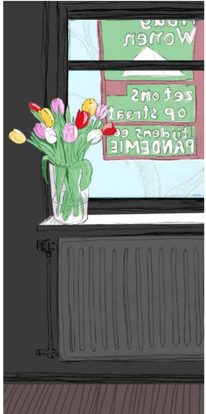
Illustratie: Babette Wagenvoort