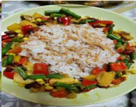
Rijst met groenten