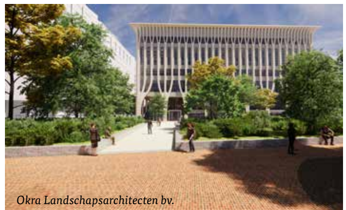
Okra Landschapsarchitecten bv.